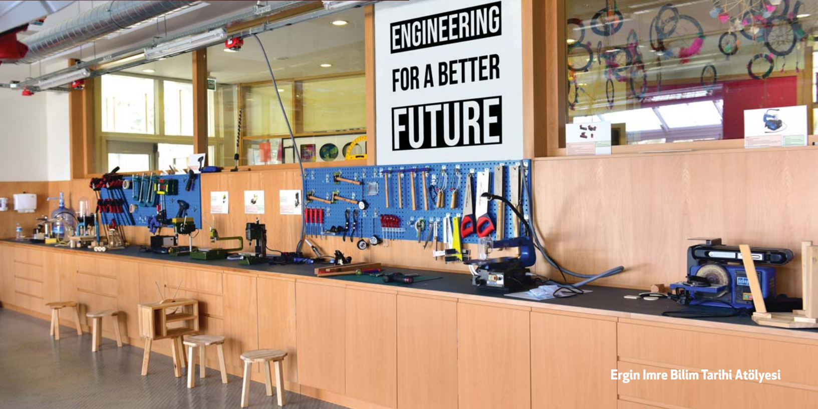
Ergin Imre Bilim Tarihi Atölyesi