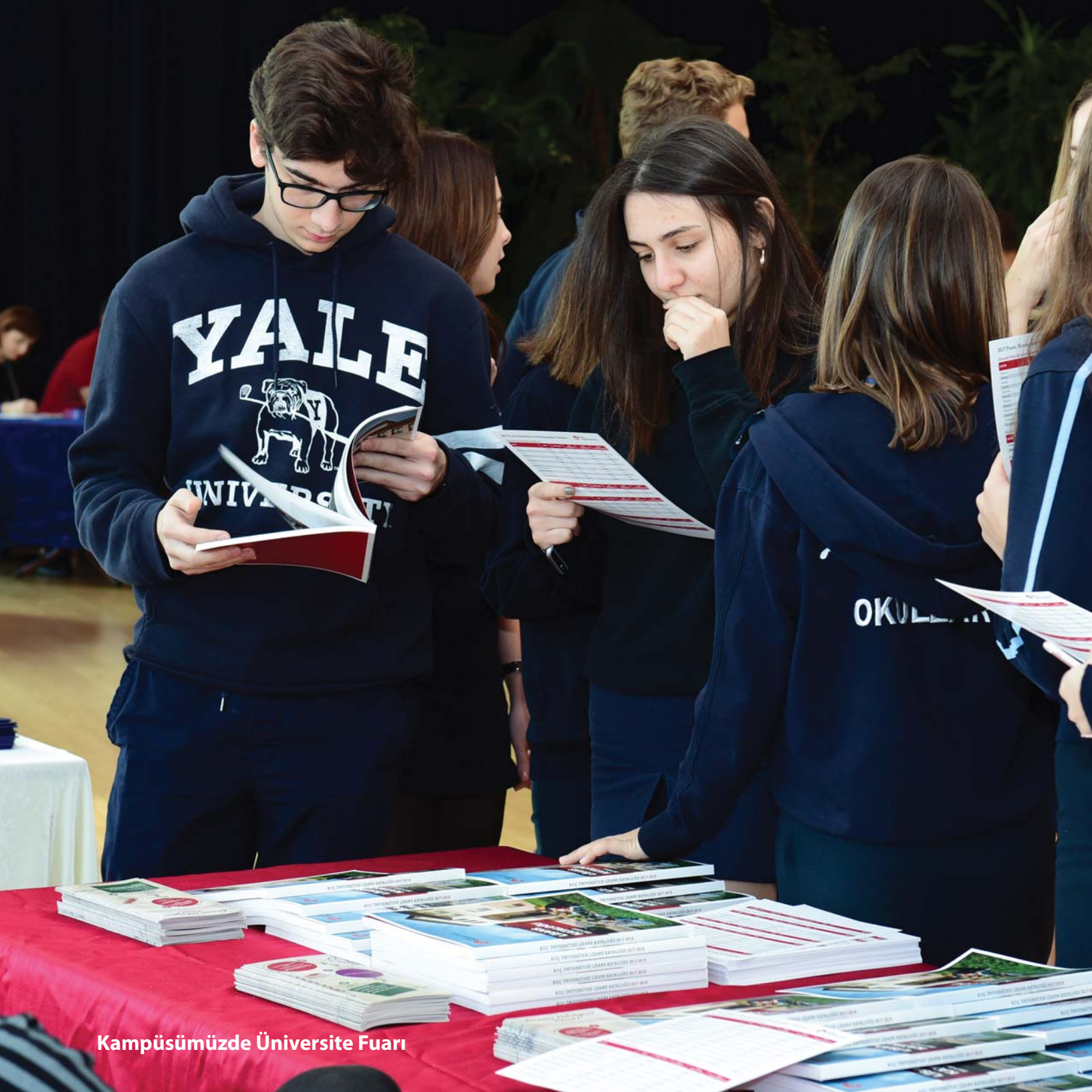
Kampüsümüzde Üniversite Fuarı