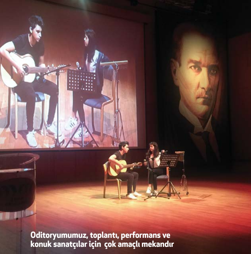
Oditoryumumuz, toplantı, performans ve konuk sanatçılar için çok amaçlı mekandır

Öğrencilerimiz yer bilimlerinde önemli bir rolü olan artırılmış gerçeklik (AR) kum havuzu ile çalışırken.