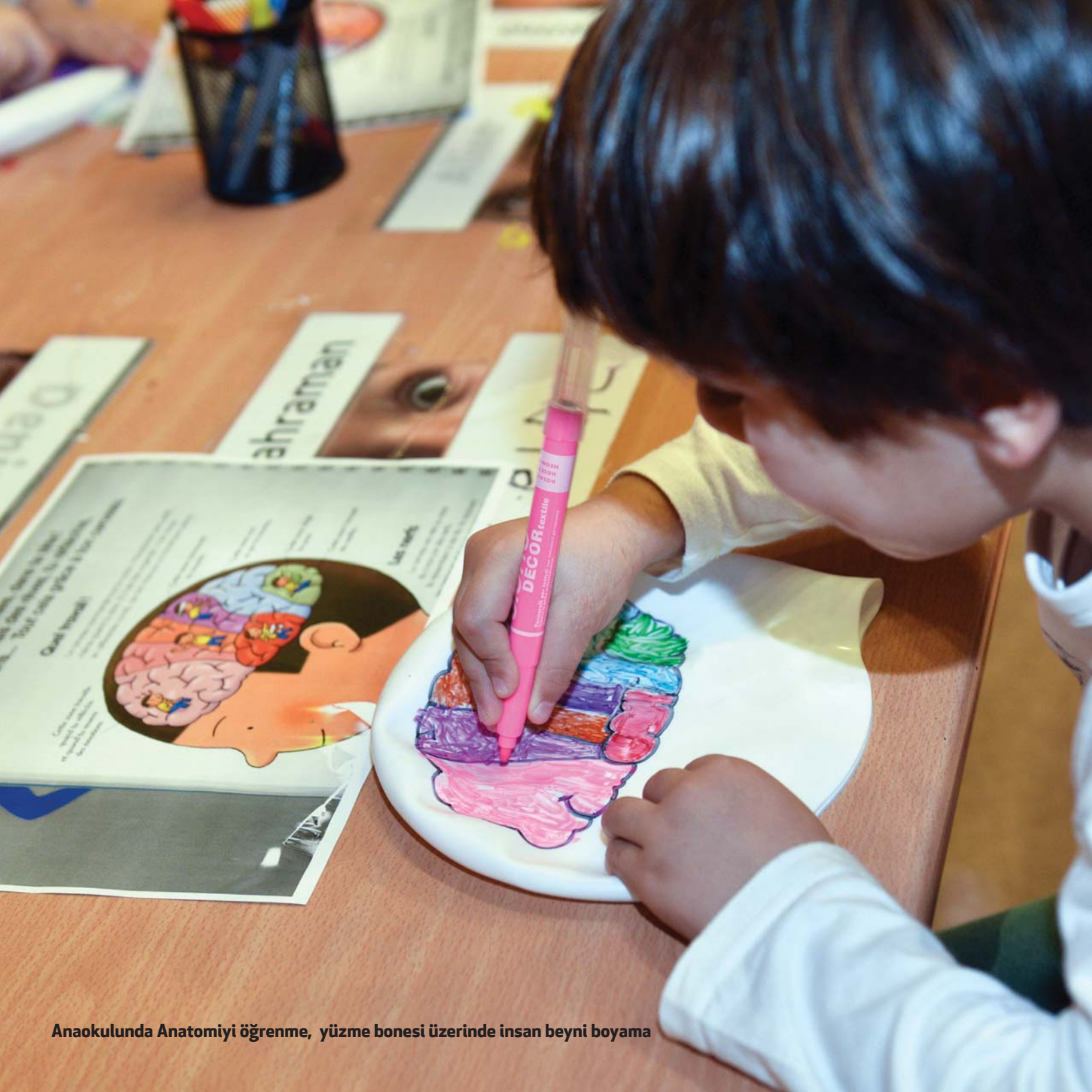
Anaokulunda Anatomiyi öğrenme, yüzme bonesi üzerinde insan beyni boyama